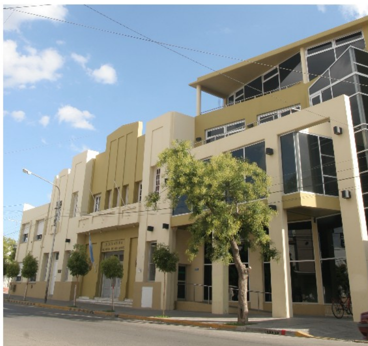
Armado, supervisión, diseño y diagramación DEPARTAMENTO CORRECCION e-mail: bkucich@legisrn.gov.ar